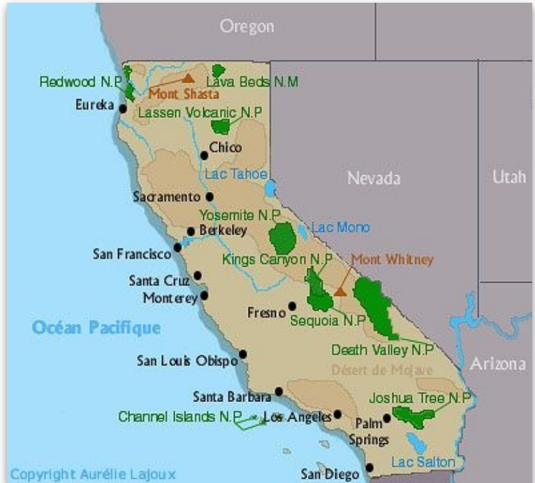
Carte simplifiée de l'État de Californie dans l'Ouest américain.

Son inscription au « Rock and Roll Hall of Fame »* en 1993 confirme son importance dans l'Histoire du Rock et de la musique américaine.