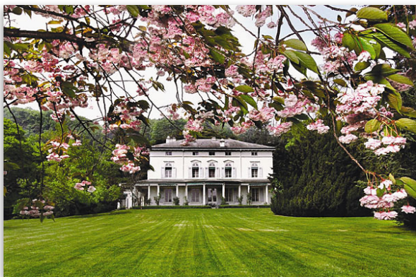
Le Manoir de Ban, dernière demeure de Chaplin.

En 1952, alors que Chaplin embarque pour Londres afin d'y présenter son film « Les Feux de la rampe », les autorités américaines en profitent pour annuler son visa de retour . S'il revient, il sera arrêté, le temps pour les autorités de vérifier qu'il est "admissible selon les lois des Etats-Unis".