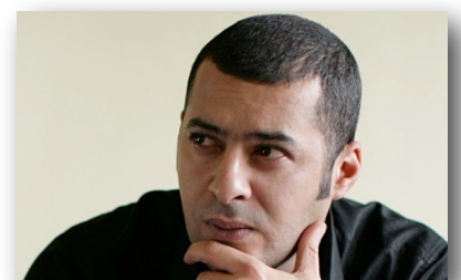
Le chanteur Ridan

Ridan, de son vrai nom Nadir Koudiri, est un chanteur français né en Seine-et-Marne le 23 juin 1975. Il rencontre le succès en 2007 avec la chanson «Ulysse», extraite de l'album L'Ange de mon démon paru la même année.