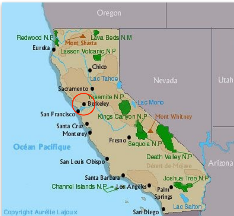
Carte simplifiée de l'État de Californie dans l'Ouest américain.

Son inscription au « Rock and Roll Hall of Fame »* en 1993 confirme son importance dans l'Histoire du Rock et de la musique américaine.